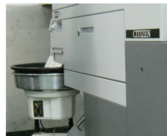
SPA-500 (標準モデル) 希望小売価格 ¥328,000 (税別)