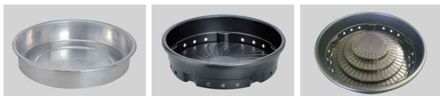
アルミバケツφ500 B0014-06-001 樹脂トレイφ500 B0014-06-013 3段ステージ付樹脂トレイφ500 B0014-06-303

この3段ステージ装着で弊社での運転実績で従来の約3倍のワーク数量の蓄積が出来るようになり、夜間無人運転時間も15~16時間に延ばすことが出来ています。(ワーク寸法φ16 L32.8mm サイクルタイム95秒)