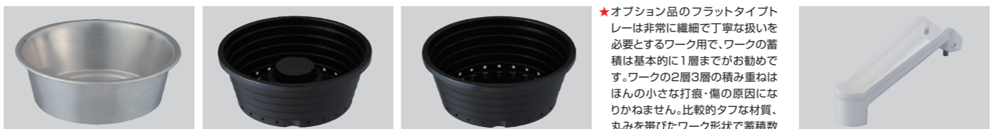
アルミバケツφ350 B2081-12-001 樹脂トレイφ350 標準付属品 段状タイプ B2081-12-003 樹脂トレイφ350 フラットタイプ B2081-12-008 (オプション品)★ シューター B2081-10-003

★オプション品のフラットタイプトレイは非常に繊細で丁寧な扱いを必要とするワーク用で、ワークの蓄積は基本的に1層までがお勧めです。ワークの2層3層の積み重ねはほんの小さな打痕・傷の原因になりかねません。比較的タフな材質、丸みを帯びたワーク形状で蓄積数量が優先される場合には段状タイプがお勧めです。